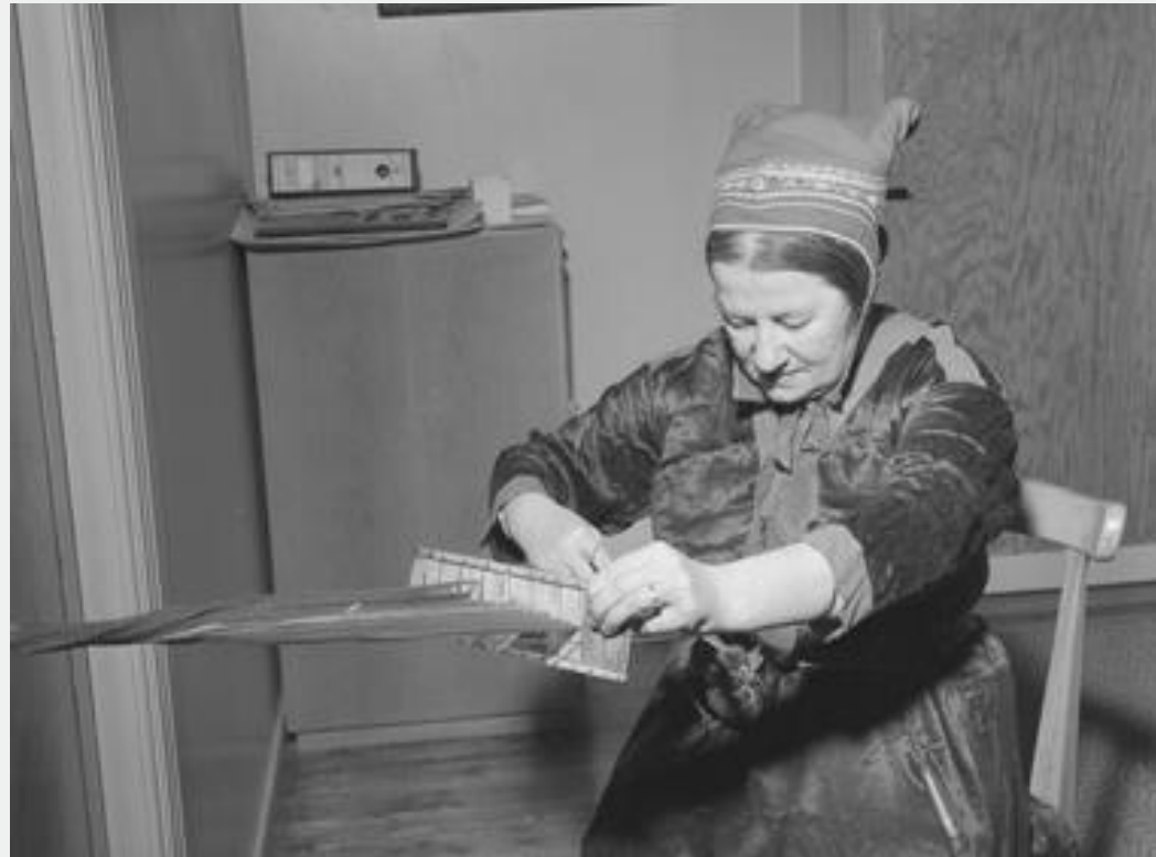
Digitalt museum. Foto: Schrøder / Sverresborg Museum, Trøndelag Folkemuseum (MiST)